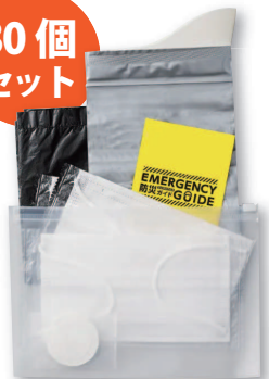
TUTS1680004 防災衛生6点セット ポーチタイプ/ クリア(30個)