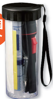
TUTS1681009 防災緊急7点セット ボトルタイプ/ ブラック(30個)