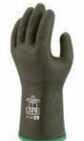
オリーブグリーン