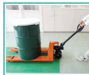
ハンドリフトにも最適