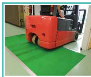
重量運搬車の屋内通路に